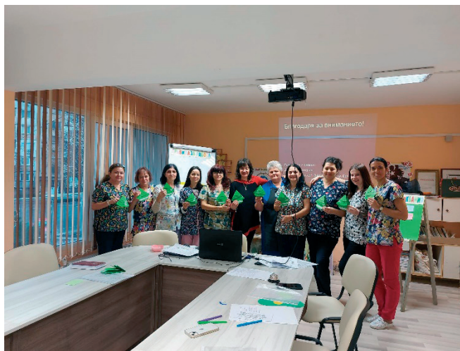
Фигура 4. Удовлетворените участници в края на тренинга

Преди края, помощник възпитателите попълват анкета, с цел получаване на информация за полезността на проведената тренинга. На въпросите: „Информацията, която получихте беше ли полезна за Вас?“, „Одобрявате ли начина на поднасяне на информацията?“ и „Имате ли желание да вземете участие в бъдещи обучения, организирани по подобен начин?“ всички са отговорили положително (фиг. 4).