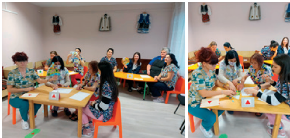
Фигура 2. Игра „Как по-добре да направим нещата заедно?“

Във втората, същинска част на трите работни групи са предложени въпроси, на които след обсъждане трябва да се даде общ отговор.