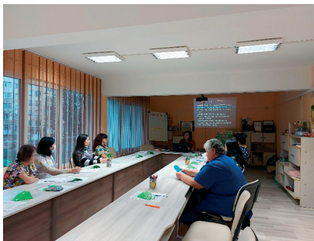
Фигура 3. Обсъждане на резултатите, даване на възможни решения

Следва обсъждане на резултатите (фиг. 3). При обсъждане на предположенията се достига до следните изводи: Детето преминава през един период на привикване към новите условия, което го поставя в състояние на тревожност. Две-три годишното дете не изпитва нужда да общува със свои връстници, докато тя не се формира. Партньор за играта е възрастният, той е образец за подражание и удовлетворява потребностите на детето за внимание и сътрудничество.