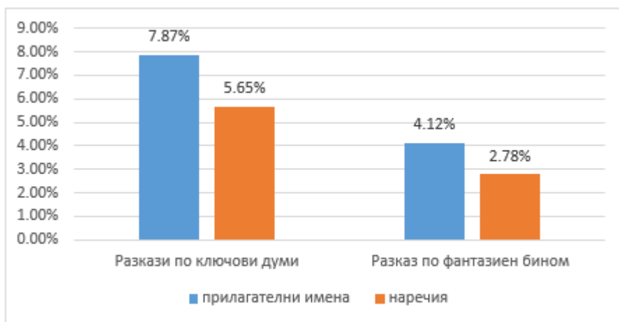
Фигура 2. Показатели на творчеството в разказите по ключови думи и фантазиен бином.

Констатираният коефициент на творчество е 0,07, който предвид по-големия обем на разказите отчитаме като нисък (Фиг. 3).