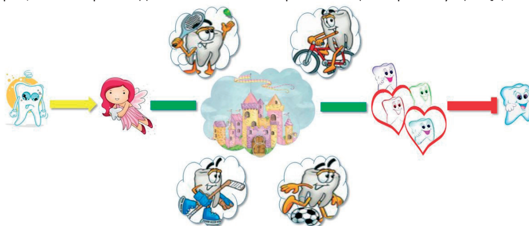
Фигура 1. План-схема на творчески разказ на тема „Как Зъбчо отиде в царството на зъбките“

Още по-сложен е етапът на статично представяне на схематичните изображения, когато децата трябва самостоятелно да обмислят сюжетната линия на своя разказ. Броят на асоциациите, които пораждаат изобразените обекти нарастват с миналия опит и знания, получават се разнообразни и вариативни разкази. Децата комбинират логически отделните епизоди и проследяват едновременно действията на различните герои, като построяват динамичен сюжет с бързо сменящи се ярки ситуации. [2, 115].