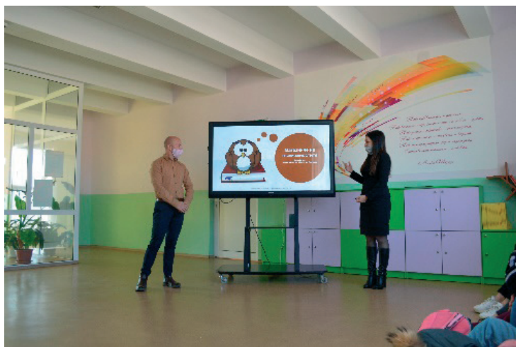
Фигура 2. Първа среща на „Магазинче на възможностите“