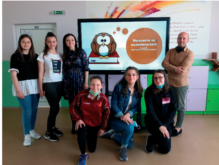
Фигура 3. Среща „Магазинче на възможностите“

Трета среща – акцентът е върху Екзистенциална интелигентност. Учене, чрез виждане на „голямата картина“; свързване на реалния свят; разбиране и прилагане на нови знания. По време на срещата учениците могат да представят своята любима снимка и да разкажат „Какъв искам да стана, когато порасна? Какви възможности ще ми даде тази професия?“ Показват се интересни картини на изкуството, рисунки, презентации и се докосваме до света на книгите. На тази среща участниците развиват умения свързани с музикална интелигентност и вербално-лингвистична интелигентност.