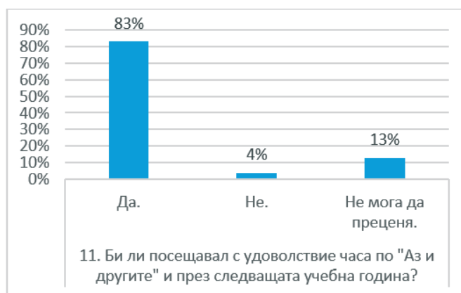
Диаграма 8. Желание на учениците да посещават часовете по социално-емоционално учене