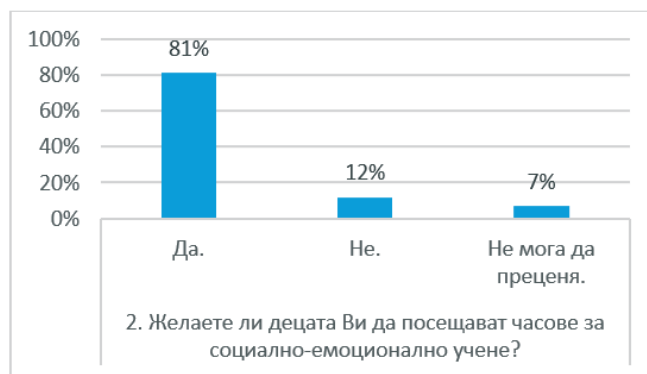
Диаграма 2. Желание на родителите за социално емоционално обучение в клас

Почти всички анкетирани – 81% са изразили утвърдително мнение, че предметът „Аз и другите“ формира позитивно социално поведение у децата. Това би означавало, че родителите осъзнават значимостта на социално-емоционалното учене. Очакват положителен ефект от преподаването върху личностното развитие на учениците, развиване на социалните им умения и изграждане на модели на социално приемливо поведение.