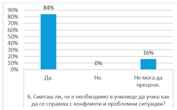
Диаграма 6. Учене за справяне с конфликти и проблемни ситуации

кта, че в клас често се бият, карат или обиждат, затова е необходимо да се научат как да общуват правилно. Според други, ученето за справяне с конфликти ще намали и предотврати насилието, ще научи учениците да владеят гнева си и да реагират адекватно в подобни ситуации и извън училище. Трети смело заявяват, че уменията за справяне с конфликти ще са им полезни в живота, ще ги накарат да се почувстват по-уверени и ще им помогнат в труден момент.