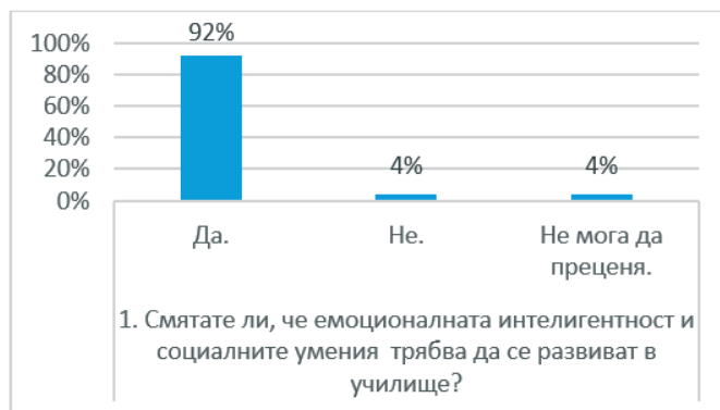
Диаграма 1. Мнение на родителите за развитието на социално-емоционални умения в училище