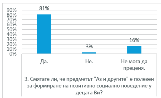
Диаграма 3. Отношение на родителите към предмета „Аз и другите“ относно неговата ефективност

Почти всички анкетирани – 81% са изразили утвърдително мнение, че предметът „Аз и другите“ формира позитивно социално поведение у децата. Това би означавало, че родителите осъзнават значимостта на социално-емоционалното учене. Очакват положителен ефект от преподаването върху личностното развитие на учениците, развиване на социалните им умения и изграждане на модели на социално приемливо поведение.