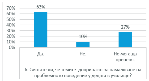
Диаграма 4. Мнение на родителите относно ефективността на темите

Сравнително висок е и процентът – 72% на онези родители, които са убедени, че предметът „Аз и другите“ помага на децата им да опознаят себе си.