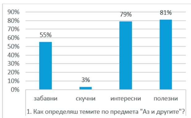
Диаграма 5. Отношение на учениците към предмета „Аз и другите“

Впечатляващо е, че по-голямата част от анкетираните ученици определят темите от социално-емоционалното учене като полезни, интересни и забавни. Това би могло да е ясен показател за положителното им отношение и повишен интерес към този вид обучение.