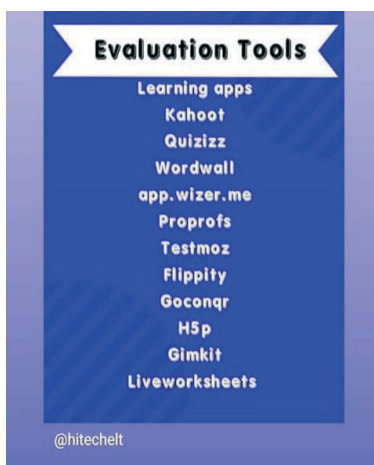
Фигура 2. Онлайн инструменти за проверка на знанията

Обратна връзка чрез платформата www.mentimeter.com е друг инструмент, чрез който се създават интерактивни презентации. За да бъде създадено забавно и ангажиращо представяне чрез този ресурс се добавят въпроси, анкети, викторини, слайдове, изображения. Участниците използват своите смартфони, за да се свържат с презентацията и да отговорят на въпросите. Техните отговори се визуализират в реално време и така се създава забавно и интерактивно преживяване за учениците. Това е полезен инструмент за учителите, защото резултатите се споделят и експортират за допълнителен анализ и дори се позволява сравняване на данни във времето, за да измери напредъка на участниците.