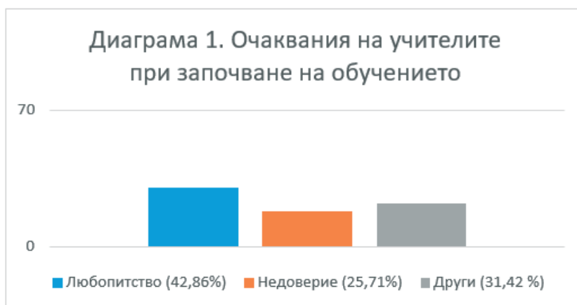
Фигура 1. Очаквани в началото на обучението.

В тази статия ще бъдат коментирани само някои от получените резултати, които са пряко свързани с разглежданата тема. Учителите започват обучението с различни очаквания и настроения (Фиг. 1): 42,86% (30 души) споделят, че са били любопитни; 25,71% (18 души) са проявили скептицизъм и недоверие. Сред останалите има респонденти, които посочват положителни нагласи като интерес, оптимизъм, вълнение, незнание, позитивизъм, желание, ентузиазъм, увереност, надежда. Има анкетирани учители, които споделят, че са започнали обучението с умора, несигурност, обърканост, разсеяност, както и с убеждение, че методите ще бъдат неприложими в реална образователна среда. Независимо от очакванията, всички изследвани лица подчертават, че са приключили тренинга щастливи, уверени, с нови знания и умения за позитивно общуване, удовлетворени, обогатени, дори приятно изненадани.