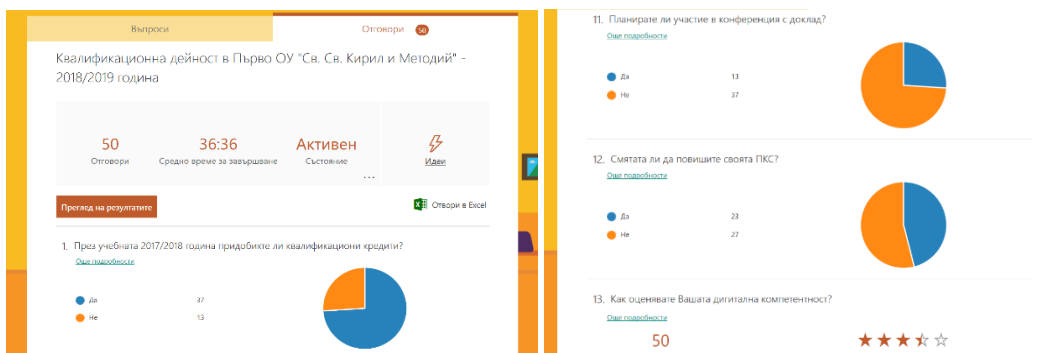
Фигура 4. Екрани от изведената статистика

След попълването на анкетата не се налага обработване и обобщаване на информацията, изискващи дълги дни и часове работа. Във файл са натрупани всички данни, изискващи се за оформяне на плана за квалификационна дейност.