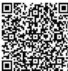
Фигура 3. QR код към анкетата

Планът за квалификация на педагогическите специалисти също бе изготвен по най-лесния начин – всички попълниха онлайн формуляр, създаден с приложението Forms и достъпен с линк и QR код.