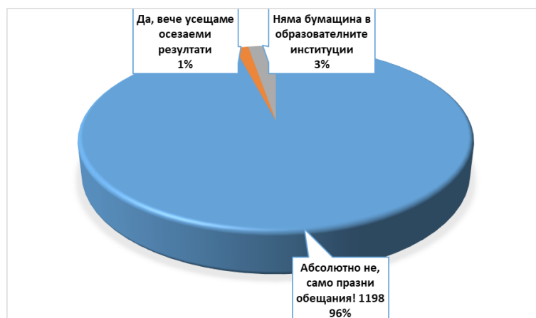
Фигура 1. Усещат ли българските учители намаляване на административната натовареност?

Диаграмата на фигура 1 показва резултатите от анкетно проучване, публикувано на сайта на синдиката с днешна дата (юли, 2019) на отговора на въпроса: Усещат ли българските учители намаляване на административната натовареност? 2 .