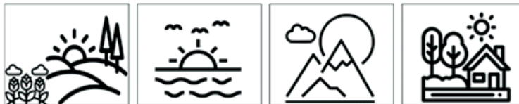
Фигура 7. Пиктограми, разкриващи осмисляне на отношението герой – времепространство (примерна задача: Оцветете картинката, показваща мястото, на което играе Дългоушко.)