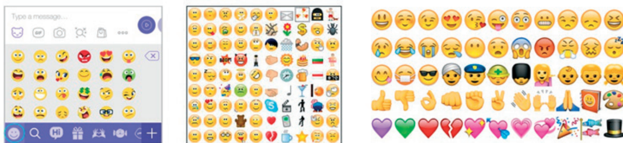
Фигура 1. Пиктограми в Skype, Viber и Facebook

Пиктограмите са перспективна, но недостатъчно изследвана област за комуникация (вербално – невербална, субектно – субектна, субектно – обектна) в педагогическия дискурс. Те навлизат активно и в учебниците по български език за начален и прогимназиален етап. Например в Буквар за 1. клас [7] и в Тетрадка по български език за 1. клас [8] сред останалите помощни знаци са включени и разнообразни пиктограми.