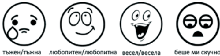
Фигура 14. Пиктограми за конкретизиране на читателското емоционално възприятие (примерен въпрос: Как се почувства, докато слушаше историята на зайко?)