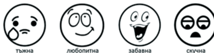
Фигура 15. Пиктограми за конкретизиране на емоционално възприятие (примерен въпрос: Каква е историята на брезичката?)