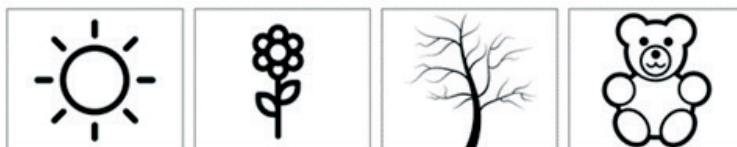
Фигура 8. Пиктограми към въпрос със структуриран отговор (примерен въпрос: С кого не си говори Дългоушко в тази история?)

Акцентът при подобни игрови конструкции е върху наблюдателността и задълбоченото осмисляне на художествения текст; вниманието е насочено върху развитието на умения (според възрастовите възможности и интереси) за откриване на отношения в текста (персонаж – персонаж, герой – времепространство, персонаж – авторово отношение, експлицирано с името на героя и др.).