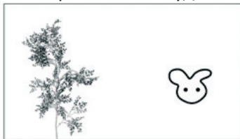
Фигура 17. Пиктограми, насочващи към изпълнение на творчески дейности (примерна задача: Допълнете изображението така, че да подхожда на описанието на природата в текста в моментите, когато са произнесени думите: „Хайде, Дългоушко, да поиграем!“ ... „Дългоушко, ела при нас!“.)