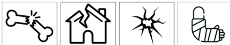
Фигура 9. Пиктограмна визуализация за разчитане на метафоричността на текст (примерен въпрос: На какво приличат счупените клони на брезичката?)