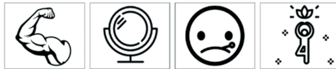
Фигура 12. Пиктограми за осмисляне на емоционално състояние на герой (примерен въпрос: Кои изображения насочват как се чувства Дългоушко в този ден?)