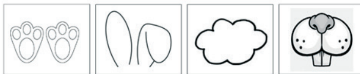
Фигура 6. Пиктограми за разкриване на знаковостта на името на герой (примерна задача: Оградете картинката, която подсказва защо героят се нарича Дългоушко.)