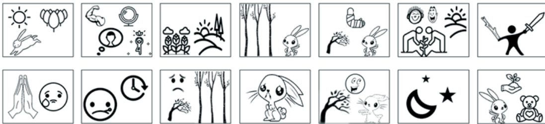
Фигура 4. Пиктограмни изображения, онагледяващи сюжетно-съдържателния модел на творбата „Зайко и брезичката“

Безброй са възможностите за формално експлициране на сюжетно-съдържателния модел на творбата. Използваните картинни изображения предполагат вариативност в моделите на визуализирането си – табло, мултимедийна презентация, илюстрационни карти, онагледяващи отделни моменти от художествените текст. Зад схематизираността на изображенията и организираността им в черно-бялата цветова палитра се крият очакванията на педагога за по-голяма активност на „провокативно“ стимулираното образно мислене на децата. Творческите задачи могат да варират: от оцветяване (цялостно – в цветова гама, според усетените доминанти и предпочитания на детето; оцветяване на отделен елемент не просто и само за игра, а с оглед изпълнение на семантична задача – епизод, свързан с...); през подреждане на епизодите съгласно логиката на текста (при вариант на съзнателно нарушена от учителя чрез изображенията хронологичност на ставането в текста); до допълване на изображение (с оглед пропуснат епизод от представената от автора случка). Подобен модел на работа стимулира асоциативната памет и въображението на децата и на следващ етап от работата може да бъде използван и за подпомагане на дейностите по устно репродуциране на текста първоизточник. (Ще ви прочета още веднъж текста, а вие ще вдигате тази картинка, която отговаря на момента, който чувате. След това ще подредите картинките по ред и с тяхна помощ ще разкажете историята.).