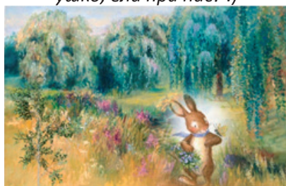
Фигура 18. Изображение за съпоставка (примерна задача: Съпоставете вашите рисунки със следното изображение. Кой момент от разказа представя то?)

Изображенията от последните три типа провокират игрова, емоционална и вербална активност върху основата на осъзната специфика и потърсена синхронност/различност в изобразителните възможности на различни визуализиращи системи (слово, изобразително изкуство, пиктография, дори и музика). В същото време „оповестяват“ функционалността на играта на словото в текста на автора. В подобен образователно-възпитателен контекст се наблюдава развитие на детския речник във връзка с необходимостта пиктограмата не само да бъде разпозната като еквивалент на определен участък от художествения текст, а и да бъде съпоставена с друга творба и „прочетена“ с думи според възможностите на децата от съответната възрастова група. Вербално-игровите ситуации по тези модели са своеобразен мост между образователното и развлекателното при работата с децата от подготвителните групи. Показват значимостта на вариативни изпълнителски модели на задачите за развитие в синхрон на различни умения в единство (предопределена от разнообразността на моделите детска активност – ограждане, разместване, подреждане, дорисуване, оцветяване, преброяване, съпоставяне на пиктограми и мн. др.).