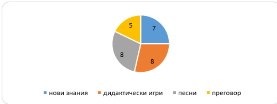
Фигура 2. Разпределение на времето по време на езикова ситуация

проси и се дават отговорите им. Ръководейки се от тези прийоми в своята работа ние разделихме езиковата ситуация на следните части (Фиг. 2): преговор, дидактически игри, нови знания и песни.