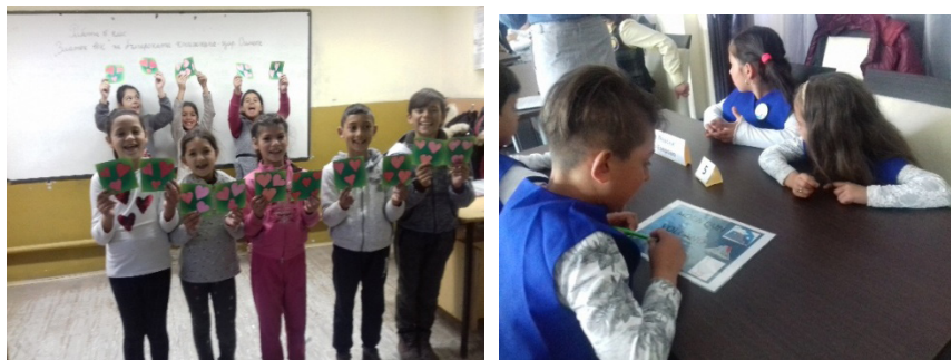
Фигура 5. Моделиране и изработване на предмети

ask the question; answer the question; say the letter and say the word; repeat after me; complete the sentence.