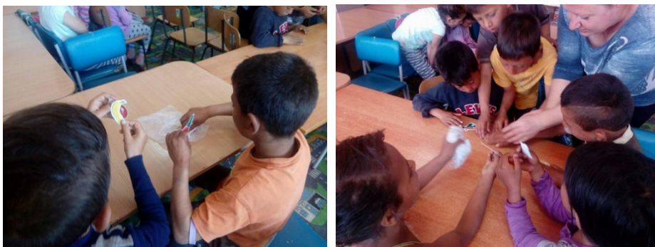
Фигура 3. Използване на нагледни средства в обучението по английски език

Освен контекста, в който се използва новата лексика, необходимо е и прилагането на разнообразни методи при въвеждането и употребата на лексиката – чрез говорещи флашкарти, предмети, рисунки, презентации, включване на изучаваните думи в разнообразни игри и песни. Използването в нашата практика нагледни средства бяха важна част от обучението по чужд език. Използването на играчки, които децата разпознават като предмети от своя свят и с които се свързват емоционално, улесни работата на учителя. Интересна разновидност на използването на играчки бе създаването на тематична кутия с предмети, свързани с урочната единица. Бяха включени различни превозни средства в кутия-паркинг, различни животни в кутия-зоологическа градина и различни цветя в кутия-градина. Това разнообрази учебния процес и позволи на 5 и 6-годишните да възприемат по-голям брой думи от дадената тематична единица. При подбора на нагледните материали съобразихме целта на използваните елементи, тяхното естетическо въздействие, така че децата да нямат съмнения в значението на представения образ (Фиг. 3).