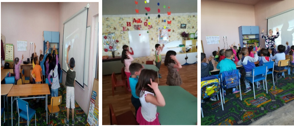
Фигура 1. Подвижни игри

Театрализираната игра, в която децата изпълняват отделни роли, дава възможност за това на практика. Детето осъзнава информацията, свързана с дадената граматическа структура и ситуация. Учителят отчита обратната и съществена връзка между неосъзнатото и осъзнато усвояване и възпроизвеждане на определена граматическа структура. Английската лексика и граматика се усвояват от детето на емпирично и рефлексивно равнище, в съответствие с конкретни теми. За това способства и научаването на стихчета и песнички на английски език. По същия начин протича обучението и в първи клас.