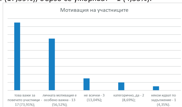
Фигура 3. Мотивация за участие

По-големият процент от анкетирани лица подчертават, че по време на тренингите, всички участници се включват активно в изпълнението на поставените задачи, но има респонденти, които не споделят това мнение (Фиг. 4): повечето, да – 15 (65,22%); участниците сами разбират, че активното им участие е единствената гаранция за постигане на успешни резултати от обучението – 14 (60,87%); не всички – 2 (8,69%); бързо се уморяват – 1 (4,35%); категорично, да – 4 (17,39%).