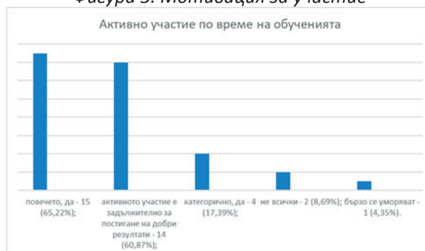
Фигура 4. Активно участие

На база получените резултати от анкетното проучване, могат да се обобщят в основни групи позитивите, които получават лицата, имали контакт с програмите, и какво губят незапознатите с тях (Табл. 1).