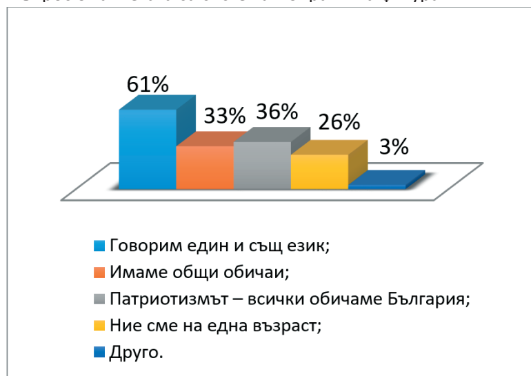
Фигура 2. Кои – според Вас – са нещата, които Ви сближават със студенти от българската диаспора?

Позитивно отношение към евентуално присъствие на представители на българската диаспора в студентското си обкръжение имат над 85% от изследваните. То градира от положително към радостно и показва съпричастност, желание за по-близки контакти, за опознаване на етническите българи, живеещи извън страната. Неутрално отношение имат 18% от изследваните, които не разграничават етническите българи от останалите чужденци, като намират и едните, и другите за приемливи. Отрицателно отношение към студенти от българската диаспора имат 4,9% от изследваните поради един чисто прагматичен факт – според тях тези студенти заемат местата на желаещи да се обучават по конкретна специалност българи, без да си дават сметка, че държавата отпуска специална квота за представители на българската диаспора. Трябва да отбележим и още една интересна подробност – по време на анкетата студентите от педагогическите специалности проведеха среща с молдовската поетеса Таня Танасова – етническа българка от молдовското село Валя Пержей. В резултат на това всички избраха радостното и позитивното отношение – почувстваха любовта, която носи в сърцето си тази представителка на българската диаспора. Отговорите на втория въпрос от анкетата са систематизирани на фигура 2.