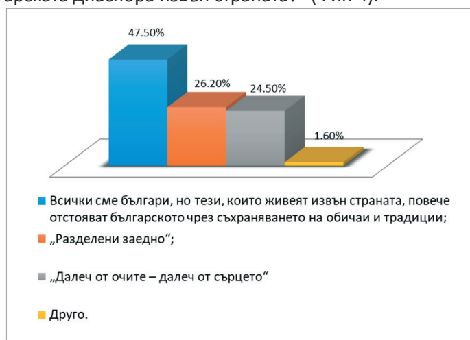
Фигура 4. Кое от твърденията – според Вас – описва най-добре отношенията между българите в България и българската диаспора извън страната?

Последният въпрос е: „Кое от твърденията – според Вас – описва най-добре отношенията между българите в България и българската диаспора извън страната?“ (Фиг. 4).