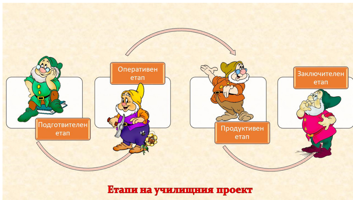
Фигура 2. Етапи на училищния проект